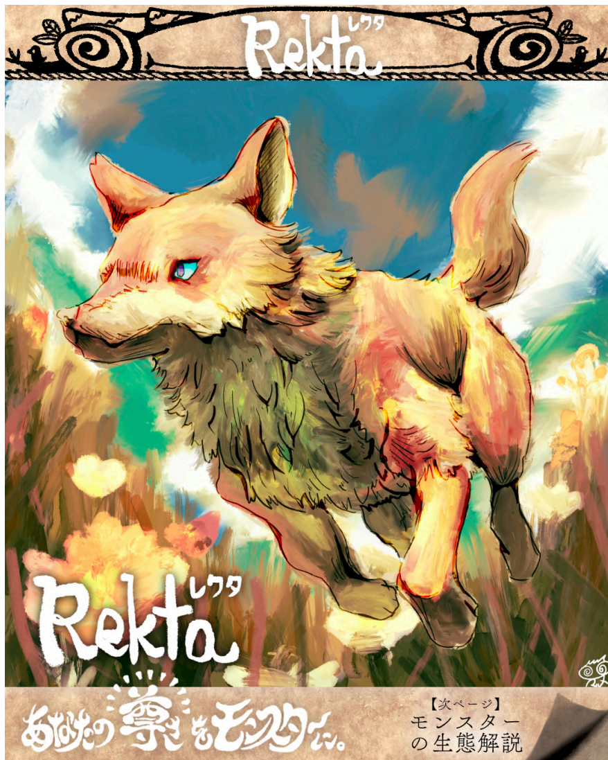
納品画像1/3 イラスト