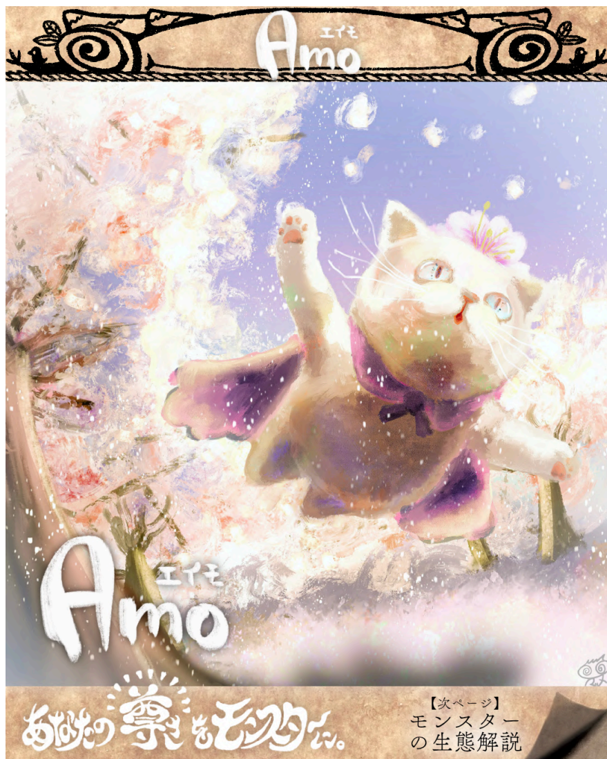
納品画像1/3 イラスト