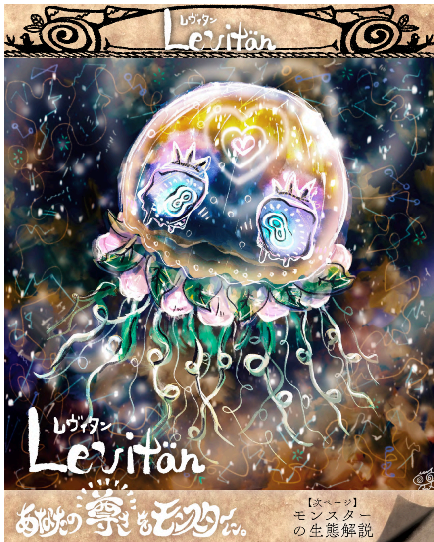
納品画像1/3 イラスト